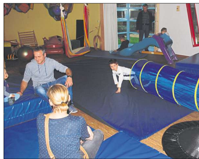
Das neue Motorikzentrum ermöglicht auf einer Fläche von 20 Quadratmetern unterschiedliche Bewegungsspiele.

Die evangelische Kindertagesstätte Huckepack bietet von der U3-Betreuung bis zu Nachmittagsangeboten für kleine Musiker, Forscher, Sportler und Köche ein durchgängiges pädagogisches Konzept, bei dem die Entwicklung des Selbstbewusstseins der Kinder eine große Rolle spielt, sagt Petra Knost. Außer von der konzeptionellen Ausrichtung waren die Gäste besonders von der offenen Architektur, dem großen Außengelände und vom neuen Motorikzentrum begeistert.